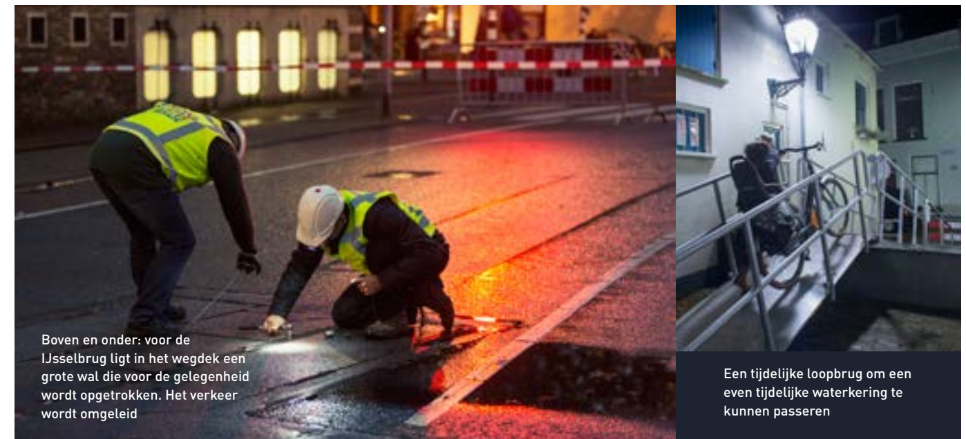
Boven en onder: voor de IJsselbrug ligt in het wegdek een grote wal die voor de gelegenheid wordt opgetrokken. Het verkeer wordt omgeleid

Ongeveer tweehonderd vrijwillige brigadiers zijn dag en nacht oproepbaar om bij dreigend hoogwater de handen uit de mouwen te steken. Stuk voor stuk stoere mannen en vrouwen, die van actie houden en die graag meehelpen aan de waterveiligheid in hun stad. Bij dreigend hoogwater met soms barre weersomstandigheden, sjouwen zij met schotten en balken langs een kade die dreigt te overstromen.