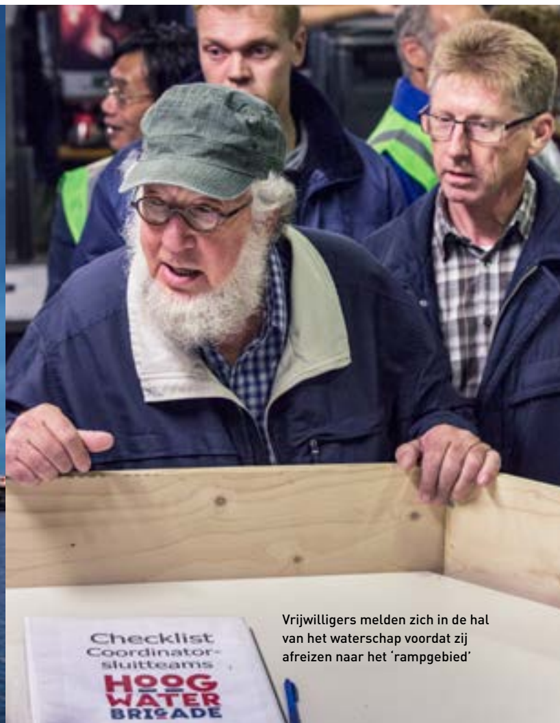
Vrijwilligers melden zich in de hal van het waterschap voordat zij afreizen naar het 'rampgebied'

In 1997 besloot waterschap Groot Salland de historische stadsmuur van Kampen onderdeel te maken van de twee kilometer lange waterkering. Waar deze stadsmuur onderbroken werd door stegen, straten of poorten zijn waterkerende elementen aangebracht. Zo zijn in de Koornmarktpoort en in het verlengde van de Botervatsteeg voorzieningen aanwezig voor schotbalken. In de Vloeddijk, in de Burgwal en in de IJsselkade aan weerszijden van de Stadsbrug bevinden zich klepkeringen in het wegdek. In de Meerminpoort, de Blauwehandpoort en de Lampetpoort zijn hefschuifkeringen aanwezig. Verder zijn enkele tientallen woningen uitgerust met waterkerende deuren. In totaal bevat de waterkering 84 beweegbare delen die voorafgaand aan hoogwater op de IJssel in stelling gebracht moeten worden.