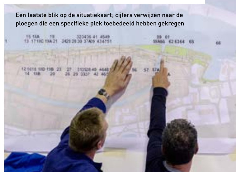
Een laatste blik op de situatiekaart; cijfers verwijzen naar de ploegen die een specifieke plek toebedeeld hebben gekregen

Tekst Charlotte Leenaers